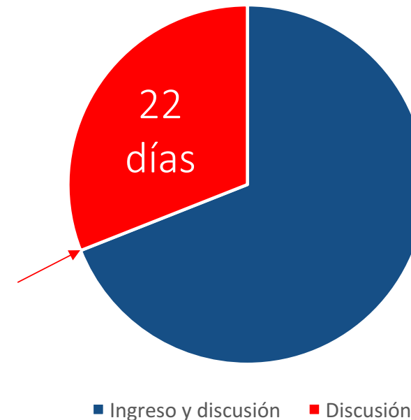
Primer retiro 22 días desde que se puso en tabla